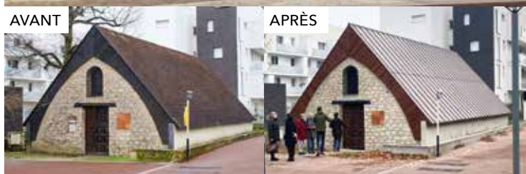
Chapelle Notre-Dame-des-Sans-Logis-et-de-Tout-le-Monde, Noisy-le-Grand (93). Réhabilitation tous corps d'état réalisée par le groupement CCR (maçonnerie, pierre de taille) et Balas (électricité et couverture).