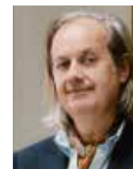
Pierre-Antoine Gatier, architecte en chef des monuments historiques