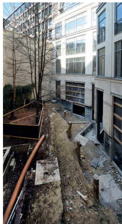
5, 6, 7 Avenue de la Grande-Armée La rénovation de ce bel immeuble de bureaux (4000 m 2 ) est effectuée en TCE par le Groupe Balas pour AG2R.