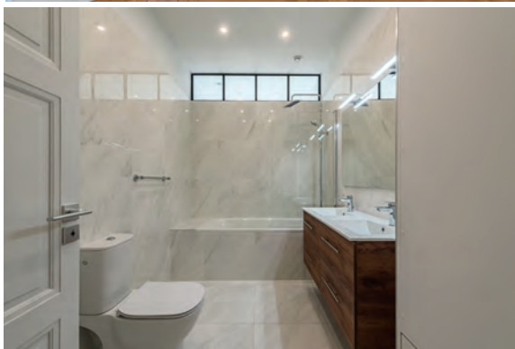
Avenue Victor-Hugo, Paris Cet appartement haussmannien haut de gamme a été réhabilité en TCE par Balas pour le compte de Esset Property Management.