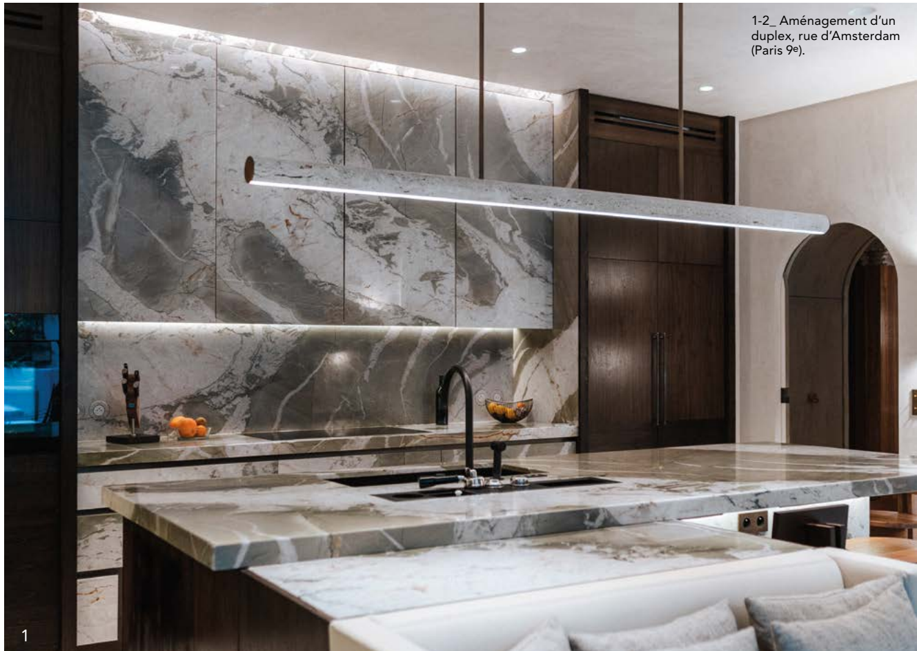
1-2_ Aménagement d'un duplex, rue d'Amsterdam (Paris 9 e ).