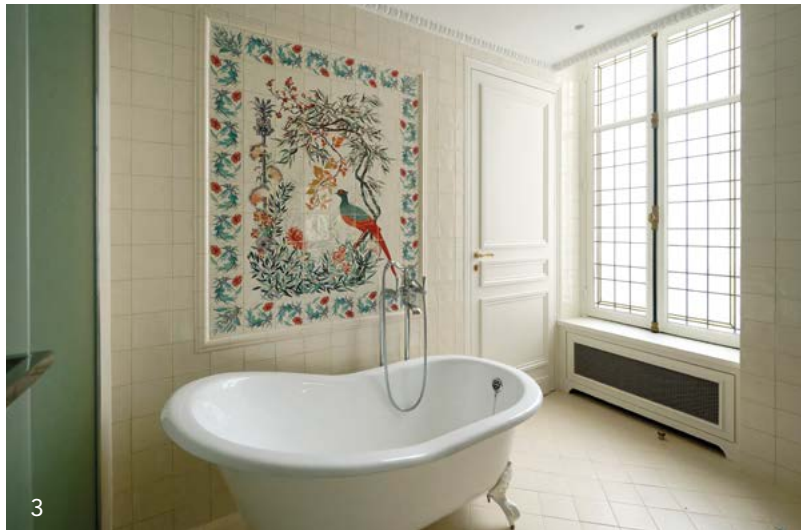
3_ Hôtel Raphaël (Paris 16 e ). Les panoplies de plomberie ont été réalisées en FHS.