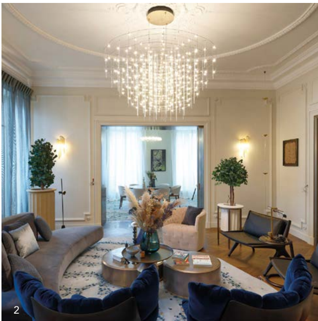
1_Transformation complète de cet immeuble de l'avenue de la Grande-Armée (AG2R La Mondiale). 2_ Aménagement de bureaux premium, 1 bis, avenue Foch (Paris 16e). 3_ Une offre globale pour la rénovation de cet ancien immeuble de bureaux (Groupama Immobilier), à Paris 8e.

... tels projets. Et réunir sous la même bannière électricité, plomberie, sanitaires, marbrerie... est un atout essentiel pour atteindre un résultat techniquement et esthétiquement parfait. Avec leurs sous-traitants soigneusement sélectionnés, ils savent faire du sur-mesure, par exemple combiner pose d'un parquet ancien et isolation acoustique irréprochable comme dans cet appartement, avenue Victor-Hugo (Paris 16e), dont ils ont su retrouver tous les « marqueurs haussmaniens ».